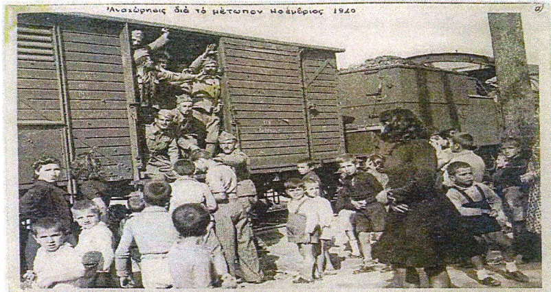
16. Αναχώρηση για το Μέτωπο Νοέμβριος 1940

Από τους μαθητές/τριες των Γ1, Γ2, Γ3 τμημάτων Του 8 ου Δημοτικού Σχολείου Θεσσαλονίκης